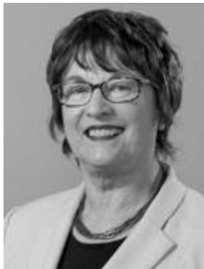
Brigitte Zypries Beiratsvorsitzende Ex-Bundesministerin für Wirtschaft und Energie, davor lang- jährige Bundesjustiz- ministerin

Der Beirat unterstützt die unabhängige Arbeit und die strategische Weiterentwicklung des DISQ.