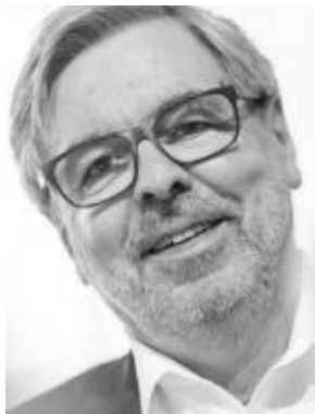
Jochen Dietrich Journalist und Experte für die Wirtschaftsmagazine des Nachrichtensenders ntv