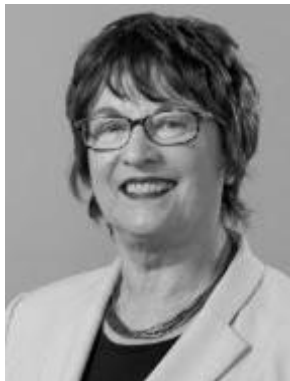
Brigitte Zypries Beiratsvorsitzende Ex-Bundesministerin für Wirtschaft und Energie, davor lang- jährige Bundesjustiz- ministerin

Der Beirat unterstützt die unabhängige Arbeit und die strategische Weiterentwicklung des DISQ.